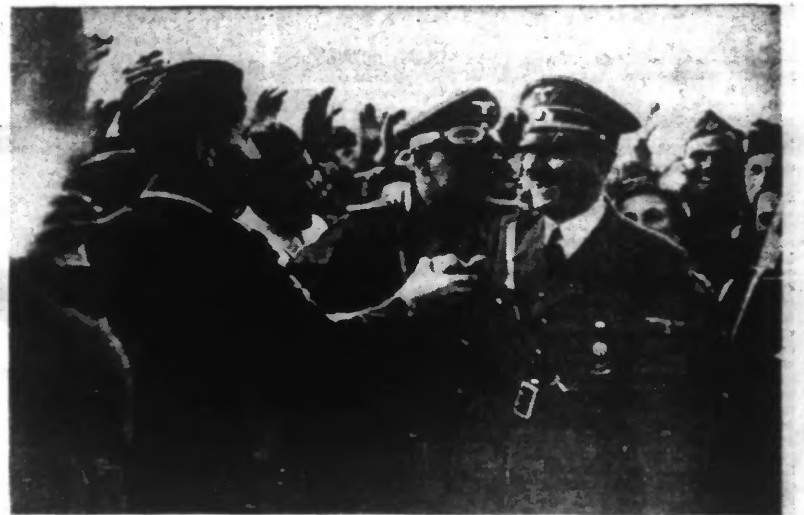
Le Fuehrer acclamé par ses soldats, au cours de la campagne de Pologne

Tokio, 29. — L'agence Doméi apprend de Rangoon que le premier ministre de Birmanie a invité jeudi les fonctionnaires de l'administration birmane pour leur donner connaissance de la déclaration du premier ministre Tojo, proclamant l'indépendance de la Birmanie.