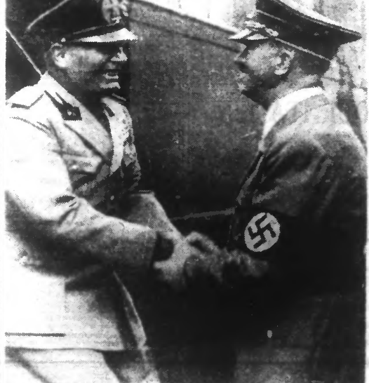
Adolf HITLER reçoit Benito MUSSOLINI au cours d'une visite que le chef du gouvernement italien a rendue au Fuehrer

Le ministre dit notamment que le Fuehrer, dans sa proclamation de Nouvel-An, avait déclaré qu'il demandait et exécutait une forte augmentation de la production allemande en 1943.