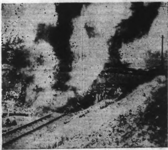
Pour enlever les attaques des insurgés, les dynamiteros viennent de faire sauter un pont sur une voie ferrée.

Gibraltar, 23. — Le bombardement de Salamanque, hier, par cinq escadrilles d'avions gouvernementaux, en mesure de représailles contre les bombardements de Valence et de Barcelone, a fait beaucoup plus de victimes qu'il n'a été dit tout d'abord. D'après les déclarations de témoins du bombardement arrivés aujourd'hui à Gibraltar, le nombre des morts serait de 225 et celui des blessés dépasserait 400. Vingt bombes seraient tombées sur la ville et une quinzaine hors de l'enceinte. Deux d'entre elles sont tombées à proximité du Grand Hôtel, siège des délégations de presque toutes les missions étrangères accréditées auprès du gouvernement de Salamanque. (LIRE LA SUITE EN CINQUIÈME PAGE)