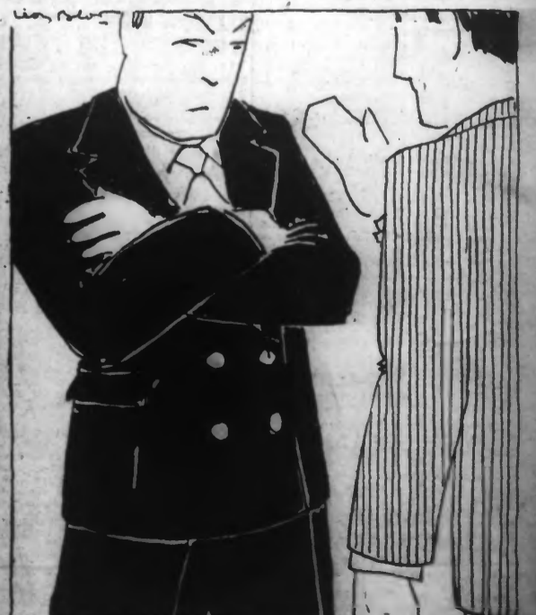
— Au milieu de ces axes : Rome-Berlin et Berlin-Tokio, que devenons-nous ? — Un « anthrax » !!!