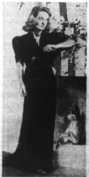
Voici la fameuse star de l'écran, Betty Davis, portant une folle toilette de soirée de velours noir. La ceinture, en soie noire, est très longue et ses extrémités tombent très bas, devant.

LIRE EN HUITIÈME PAGE NOTRE « PAGE FÉMININE »