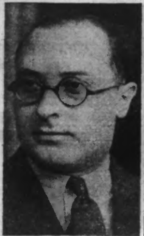
M. Jean ZAY

Paris, 23. — M. Jean Zay, Ministre de l'Éducation Nationale a présidé à Caen, une manifestation organisée par la Fédération Radicale et Radical-Socialiste du Calvados, pour fêter les succès radicaux dans ce département aux dernières élections cantonales. Le ministre a prononcé un discours dans lequel, évoquant les derniers événements politiques il a déclaré :