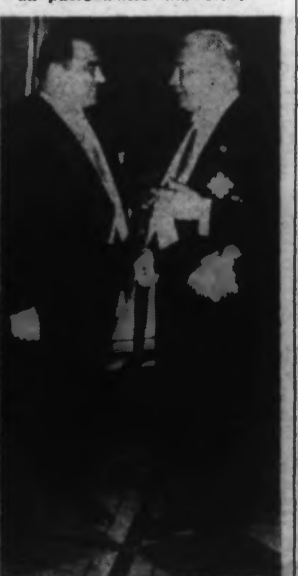
M. STOYADINOVITCH (à gauche), Président du Conseil yougoslave, et M. VON NEURATH, Ministre des Affaires étrangères du Reich, en conversation lors de la réception donnée en l'honneur des visiteurs yougoslaves à la Présidence du Reich à Berlin.