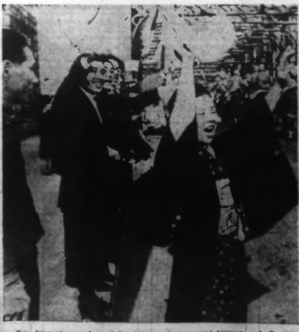
Des Japonaises acclament les troupes nipponnes qui défilent sur le Garden Bridge (district de Hongkong).