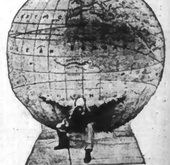
Cette mappemonde construite en pierre est connue en tous les pays par sa composition et l'homme qui a consacré sa vie à son étude. W. W. Ph.