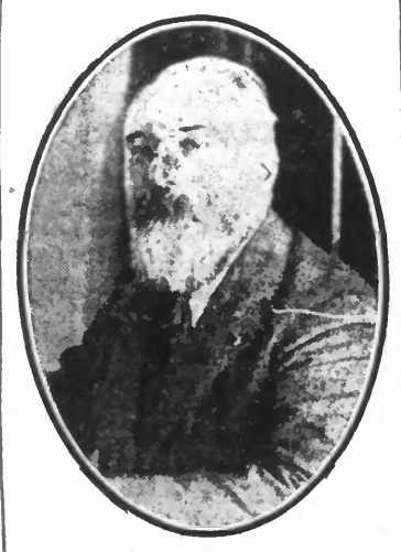
M. Pierre Pasquier qui vient d'être nommé Gouverneur Général de l'Indo-Chine en remplacement de M. Alex. Varenne.