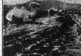
C'est cette bordée de champs et d'étalages de pierre, qui conduit aux tombeaux des Empereurs. On sait qu'au cours des récents troubles ces tombeaux qui renfermaient d'immenses richesses ont été pillés.