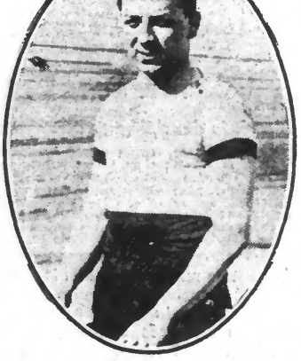
Le cycliste français Lucien Michard qui vient de remporter pour la deuxième fois, à Budapest le Championnat du monde de vitesse.